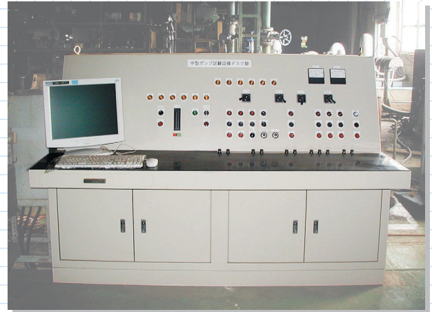
中型試験操作デスク盤