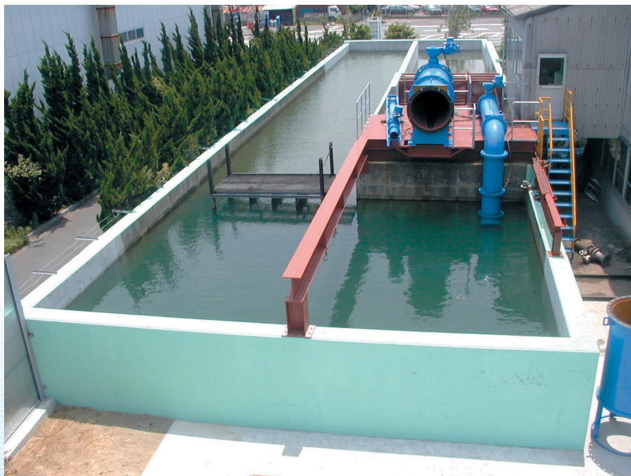
大型試験水槽全景